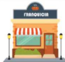
Ejemplo de tu anuncio nativo (300x250)