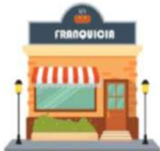
Ejemplo de tu anuncio de imagen (300x250)