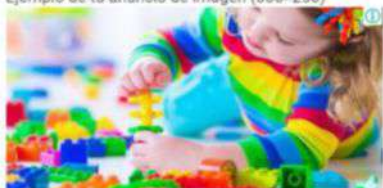
Ejemplo de tu anuncio de imagen (300x250)