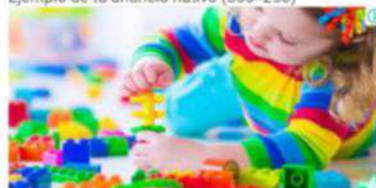
Ejemplo de tu anuncio nativo (300x250)